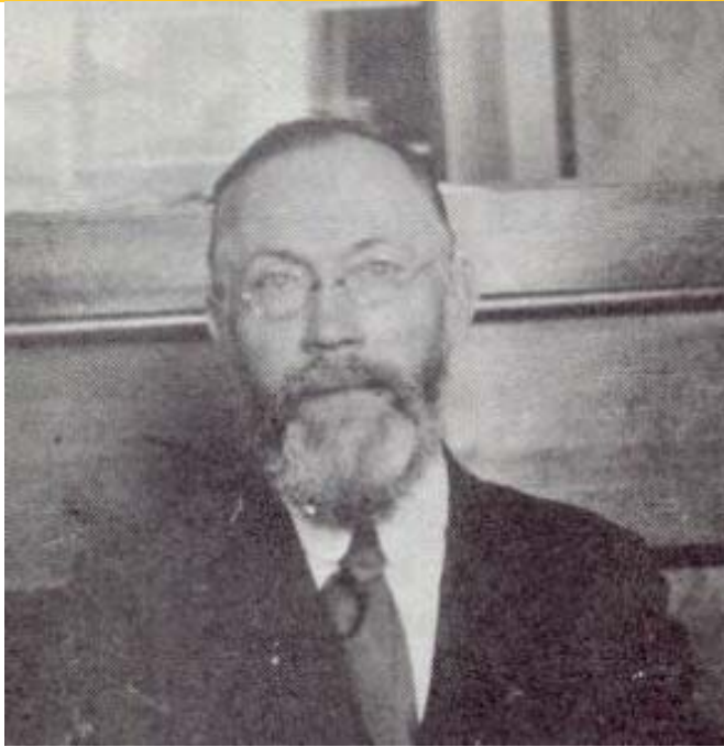
آنتون پانه کوک

روش شناختی با اکونومیسم سرنوشت باور کائوتسکیستی بود. استدلال های رزا لوکزامبورگ در «جزوه ی جونئوس» درباره ی مسئله ی ملی اساساً سیاسی است و به هیچ پیش داوری مکانیستی متکی نیست.